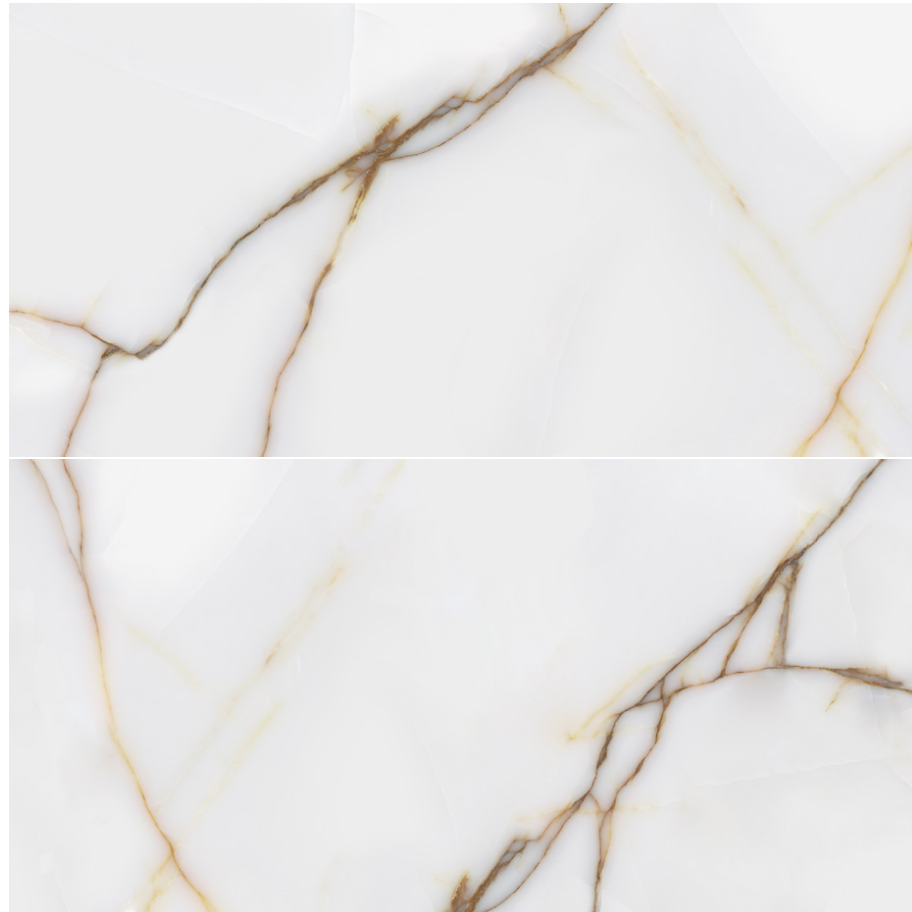
icon 60x120/24"x48" rectified 5901503221028