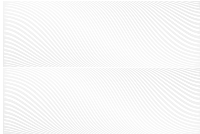
perla white onda 30x90/12"x36" rectified 5903943502813