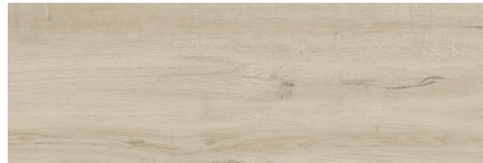
divedro cream 30x90/12"x36" rectified 5903943502493