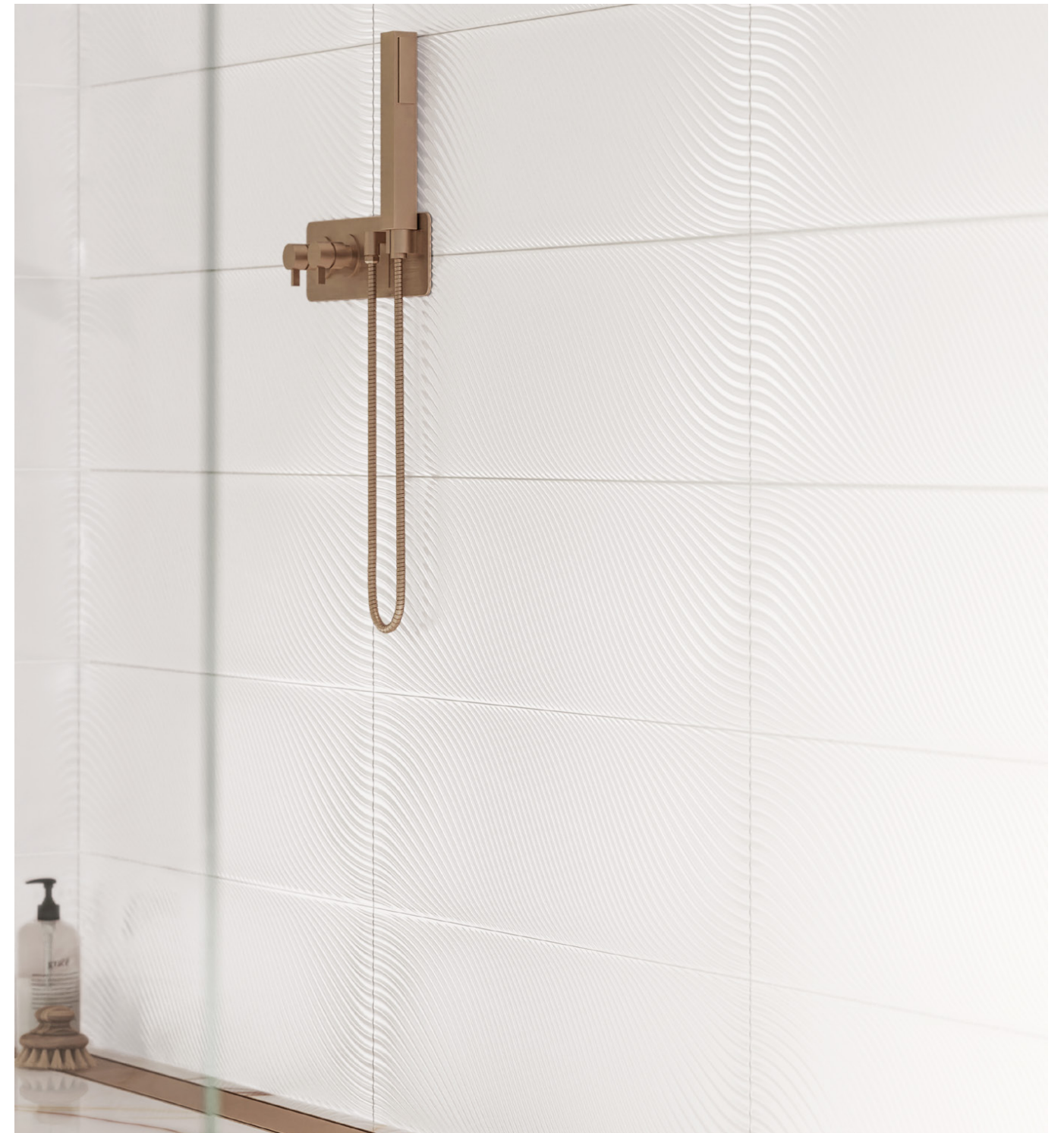
perla white onda 30x90/12"x36" /rectified/