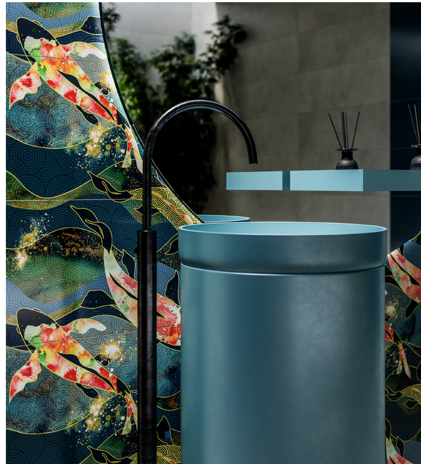
red koi decor 30x90/12"x36" /rectified/